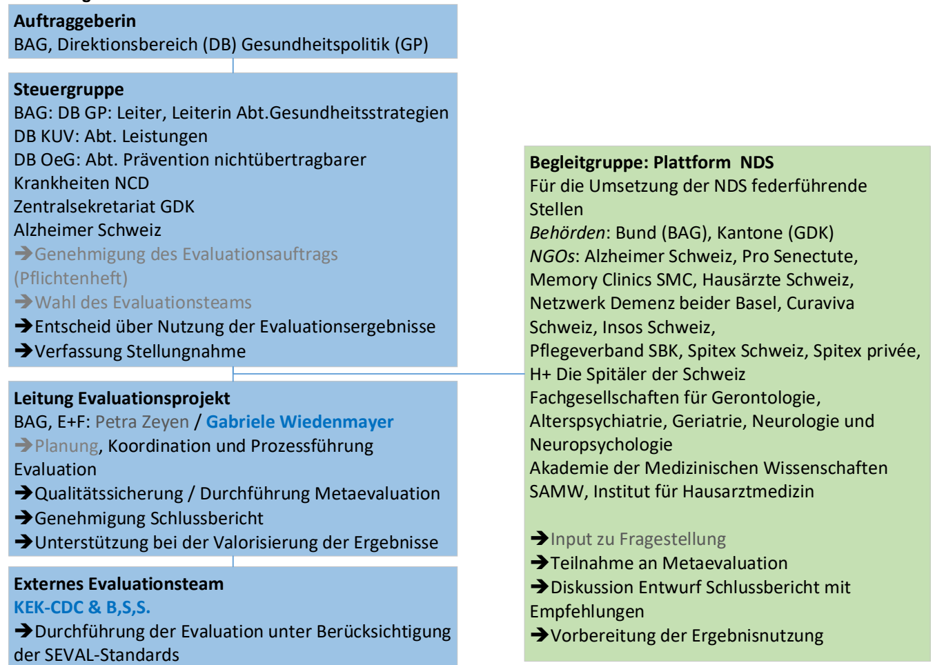
Abb. 4 Organisation Externe Evaluation NDS

Die Steuergruppe entscheidet als Hauptnutzerin der Evaluation unter Berücksichtigung der Evaluationsergebnisse über das weitere Vorgehen zur Demenzpolitik nach 2019 und verfasst eine Stellungnahme, die zusammen mit dem Evaluationsbericht veröffentlicht wird. Begleitet wird die Evaluation durch die Plattform NDS, in welcher die für die Umsetzung der Strategie federführenden Stellen (Bund, Kantone und Organisationen) vertreten sind. Zu den Aufgaben der konsultativen Begleitgruppe gehören insbesondere die Ermöglichung des Datenzugangs und die Prüfung der Ergebnisse und Empfehlungen.